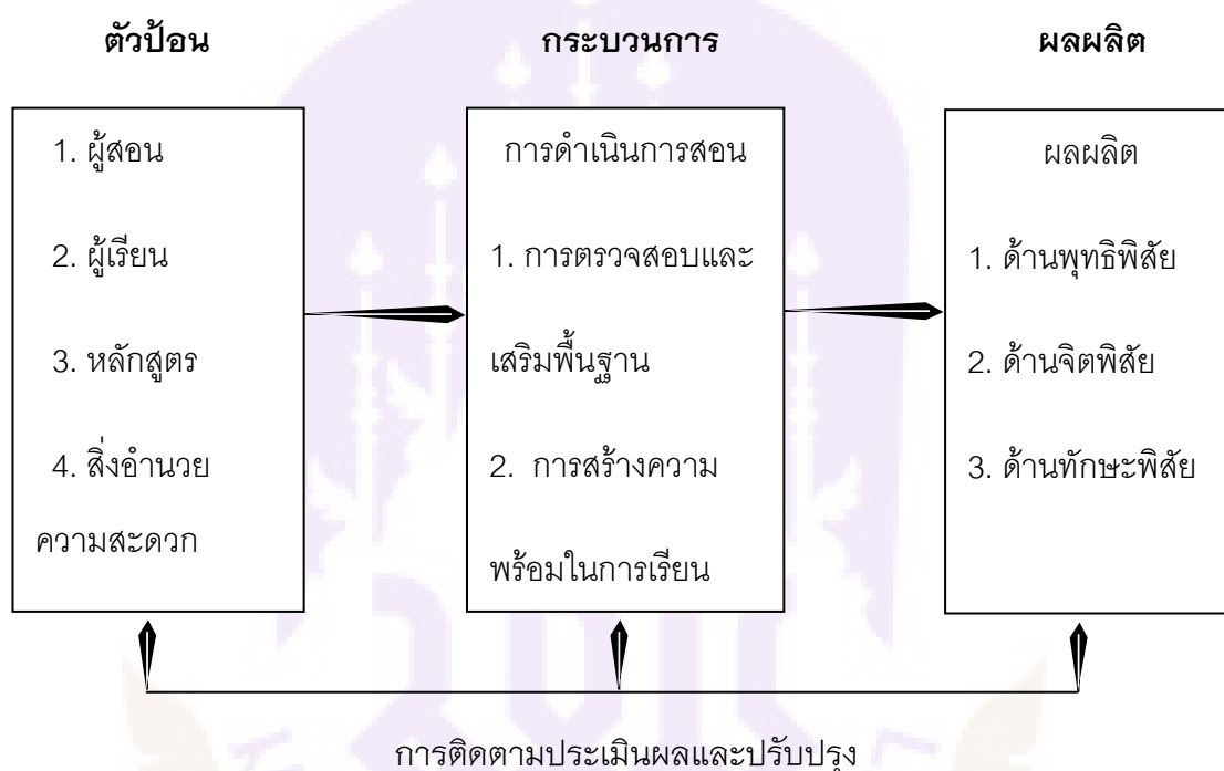
ภาพ 1 แสดงกระบวนการพัฒนาการสอน

จากแนวคิดดังกล่าวข้างต้น การจัดการเรียนการสอนเป็นขั้นตอนการนำหลักสูตรไปแปลงสู่การปฏิบัติโดยการจัดปัจจัยต่าง ๆ ภายในสถานศึกษาให้เอื้อต่อการนำไปใช้ จึงจำเป็นที่ผู้สอนจะต้องพัฒนาการสอนของตนเองอยู่เสมอ ในการพัฒนาการสอนจำเป็นต้องจัดการเรียนการสอนอย่างเป็นระบบ ดังภาพ 1