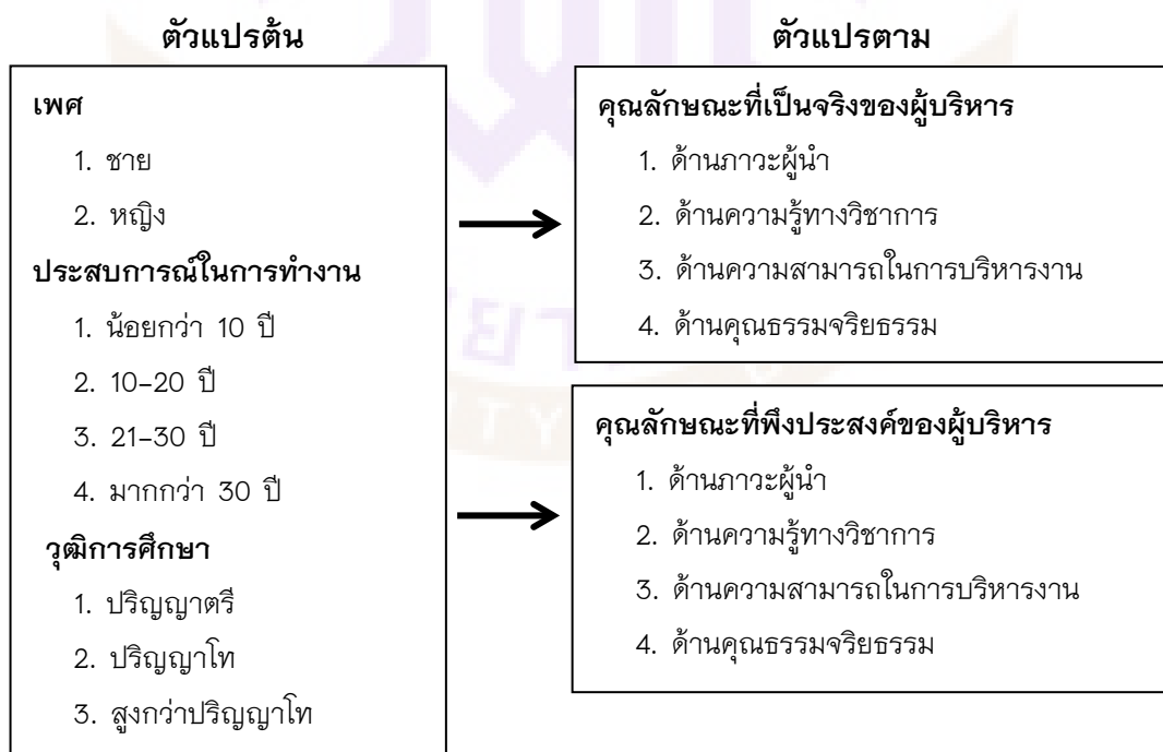
ภาพ 1 กรอบแนวคิดในการวิจัย

ในการวิจัยครั้งนี้ ได้กำหนดกรอบแนวคิดในการวิจัยคุณลักษณะที่เป็นจริง และคุณลักษณะที่พึงประสงค์ของผู้บริหารโรงเรียนราชประชานุเคราะห์ กลุ่ม 6 ภาคเหนือ ตอนบน สังกัดสำนักบริหารงานการศึกษาพิเศษ ดังนี้