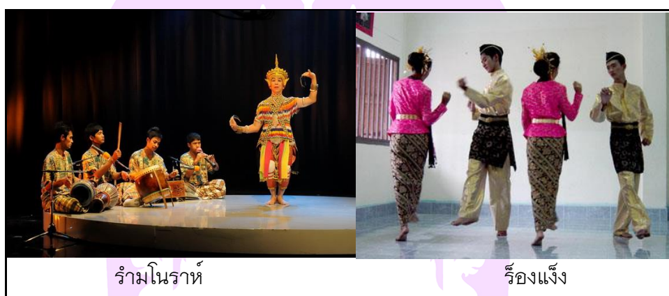
ร้ามโนราห์

อย่าลืมกอรี ลืมเสียงหนังลุง เสียงกลองเต้ตุงของมโนราห์ อย่าลืมร้องแง ลืมแกงพุงปลา กลับเถิดกลับมา กลับใต้บ้านเรา พี่จึ่งร้องเป็นเพลง บรรเลงฝากสายลมพา จากสวนยางพารา ฝากลมมา มาหานงเยาว์ (บ่าววี อารัษยาม, เพลงอย่าลืมเมืองใต้, 2555)