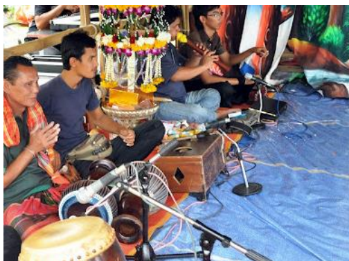
ภาพ 10 แสดงเครื่องดนตรีมโนราห์