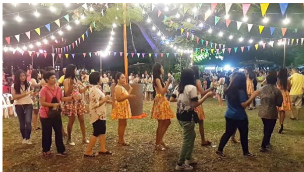
ภาพ 4 แสดงรำวงเวียนครก