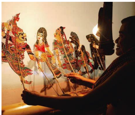
ภาพ 5 แสดงหนังตะลุง