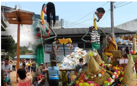
ภาพ 6 แสดงงานสารทเดือนสิบ