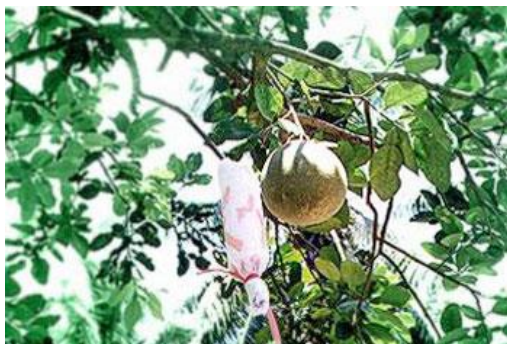
ภาพ 7 แสดงใจแขวนบนต้นไม้