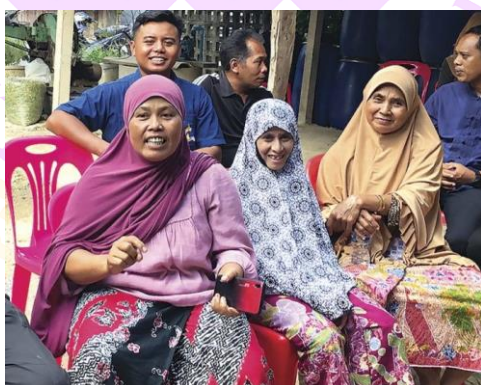
ภาพ 13 แสดงคนภาคใต้นุ่งผ้าปาเต๊ะ