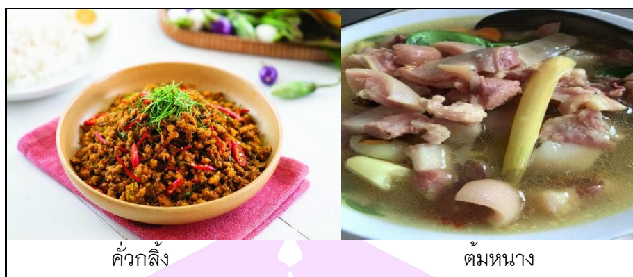
คั่วกลิ้ง