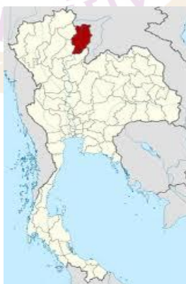
ภาพ 3 แผนที่ตั้งจังหวัดน่าน

จังหวัดน่าน เป็นจังหวัดที่ตั้งอยู่ภาคเหนือตอนบนทางด้านตะวันออก มีความโดดเด่นด้านวัฒนธรรมของล้านนาตะวันออก ที่รู้จักในนาม “สุดปลายฟ้า ล้านนาตะวันออก” ที่นักท่องเที่ยวนิยมขนานนามอีกชื่อว่า “คู่มือหลวงพระบาง” ห่างจากกรุงเทพฯ ประมาณ 668 กิโลเมตร นักท่องเที่ยวส่วนใหญ่ใช้เวลาเดินทางโดยรถยนต์ประมาณ 8-10 ชั่วโมง สามารถเดินทางได้ทั้งรถยนต์ รถโดยสารประจำทาง และทางอากาศ จากกรุงเทพฯ-น่าน