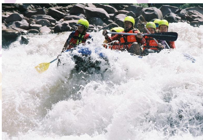
ภาพ 7 กิจกรรมการล่องแก่งน้ำว้า

การล่องแก่งนับเป็นวิถีของสายน้ำที่นอกเหนือจากการได้สนุกสนานกับการผจญภัยกับกิจกรรมล่องแก่งน้ำว้าแล้ว ยังได้พบภูมิประเทศอันงดงามของธารน้ำป่าเขา สัมผัสสภาพธรรมชาติที่น่าสนใจตั้งแต่พืชพรรณ นก แมลง ผีเสื้อและปลา สิ่งเหล่านี้คือคุณค่าที่ไม่ควรมองข้ามและจากที่กล่าวมานั้น น่าน จัดว่ามีความเพียบพร้อมในการพาผู้มาเยือนเข้าสู่สัมผัสความบริสุทธิ์ของธรรมชาติและสนุกกับการผจญภัยล่องแก่งบนสายน้ำว้า ที่มีชื่อเสียงโด่งดัง