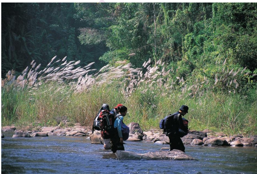
ภาพ 6 กิจกรรมเดินป่าศึกษาธรรมชาติ

จังหวัดน่านมีแหล่งท่องเที่ยวเดินป่าทั้งที่อยู่ในรูปแบบเส้นทางศึกษาธรรมชาติระยะสั้นและระยะไกล ให้เลือกมากมายเลยทีเดียว โดยเส้นทางศึกษาธรรมชาติในระยะสั้นจะอยู่ใกล้ ๆ กับตัวที่ทำการอุทยานฯ เช่น อุทยานฯ ดอยภูคา, อุทยานฯ ศรีน่าน และอุทยานฯ แม่จริม เป็นต้น ในเส้นทางเดินจะไม่ลำบากจนเกินไป บางสถานที่อาจมีนักสื่อความหมาย เจ้าหน้าที่อุทยานฯ คอยเป็นผู้นำทางให้คำแนะนำและบรรยายเกี่ยวกับระบบนิเวศน์ของธรรมชาติทั้งพืชพรรณและสัตว์ป่า บางเส้นทางนักท่องเที่ยวสามารถเดินชมเองได้ เพราะมีเส้นทางที่ชัดเจนและมีป้ายสื่อความหมายให้ความรู้ตามจุดต่าง ๆ