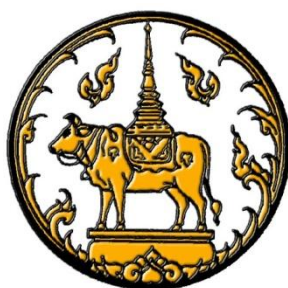
ภาพ 2 ตราประจำจังหวัดน่าน

เป็นรูปพระธาตุแช่แห้ง ประดิษฐานบนหลังโคอศุภราช