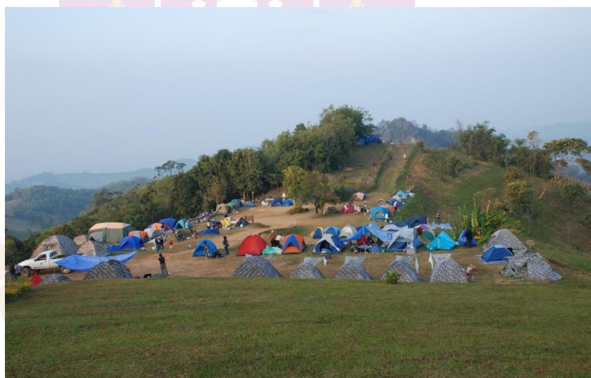
ภาพ 5 กิจกรรมการตั้งแค้มป์พักแรม

อนุสรณ์สถานภุชยัคฆ์ อนุสรณ์สถานที่สำคัญทางประวัติศาสตร์การต่อสู้ของลัทธิ การปกครองที่แตกต่าง ปัจจุบันยังคงสภาพเดิมไว้เพื่อให้อนุชนรุ่นหลังได้ศึกษา